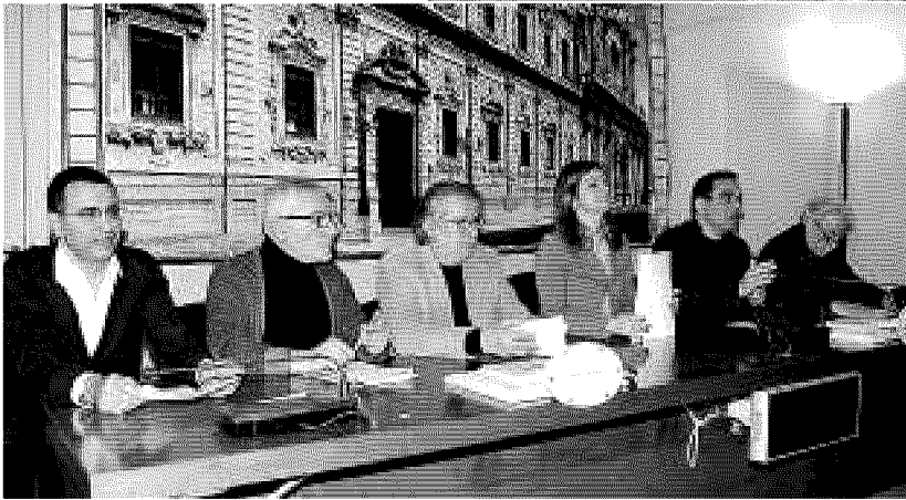
LA PRESENTAZIONE Incontro a palazzo Adorno; in alto, Carmelo Bene