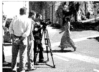
Un set cinematografico