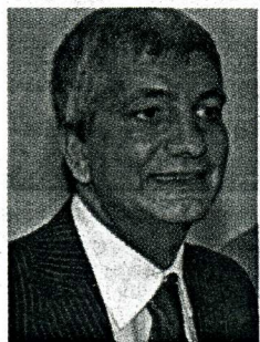
Il governatore Nichi Vendola

● BARI. «È un fatto grave ma non deve passare il messaggio che in Puglia non si possono girare film perché è vero esattamente il contrario». Lo ha detto ieri mattina il presidente della Regione Puglia, Nichi Vendola, in apertura dei lavori del Consiglio regionale, a proposito della richiesta di pizzo fatta a Taranto alla troupe diretta dalla regista Lina Wertmüller. «In Puglia - ha detto Vendola - sono quattro i film attualmente in lavorazione grazie all'impegno di Apulia Film Commission e tanti altri ancora ne sono stati già girati senza che vi siano stati problemi di questo tipo».