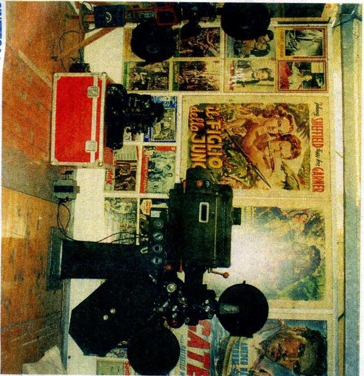
CINETECA LUCANA Locandine e cinesprese nell'archivio di Oppido Lucano (Pz)