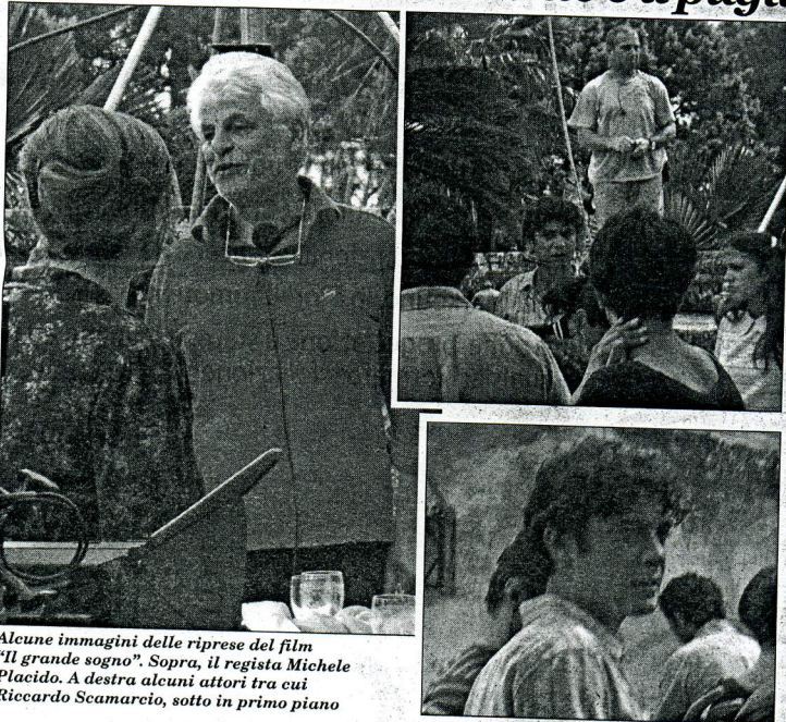
Alcune immagini delle riprese del film "Il grande sogno". Sopra, il regista Michele Placido. A destra alcuni attori tra cui Riccardo Scamarcio, sotto in primo piano